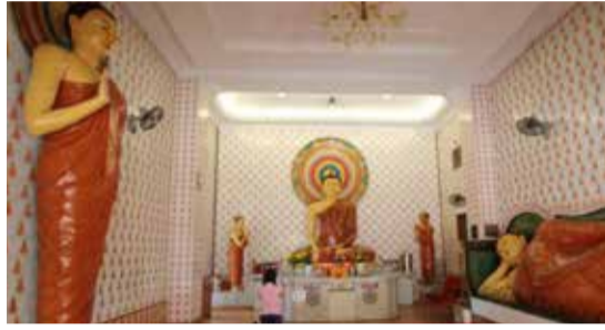
曾宏挥 成人周日佛学班 Sanghamitta 1