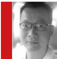
© 潘建强 / 成人周日佛学班 (Sanghamitta 2)